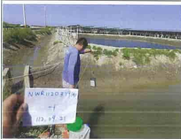
樣品名稱：下山子寮上排 1 樣品編號：NWR1120379-01