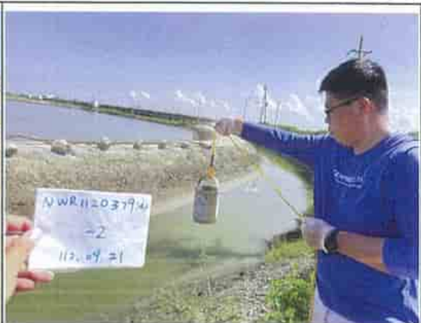
樣品名稱：下山子寮上排 2 樣品編號：NWR1120379-02