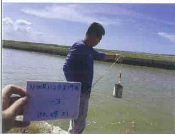
樣品名稱：下山子寮上排 3 樣品編號：NWR1120379-03