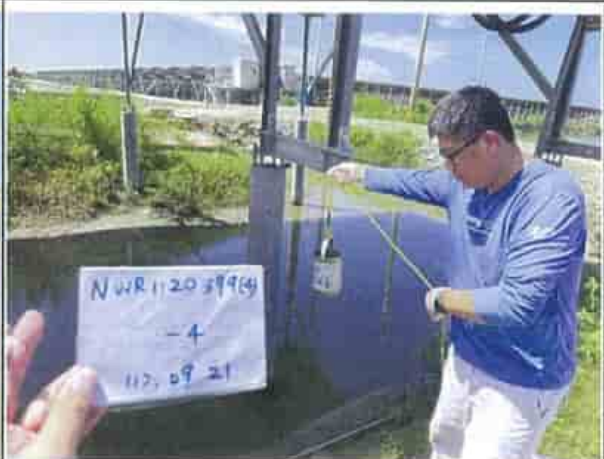
樣品名稱：下山子寮上排 4 樣品編號：NWR1120379-04