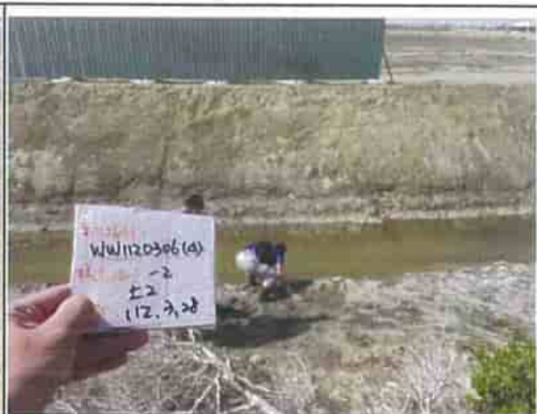
樣品名稱：下山子寮上排 2 樣品編號：WW1120306-02