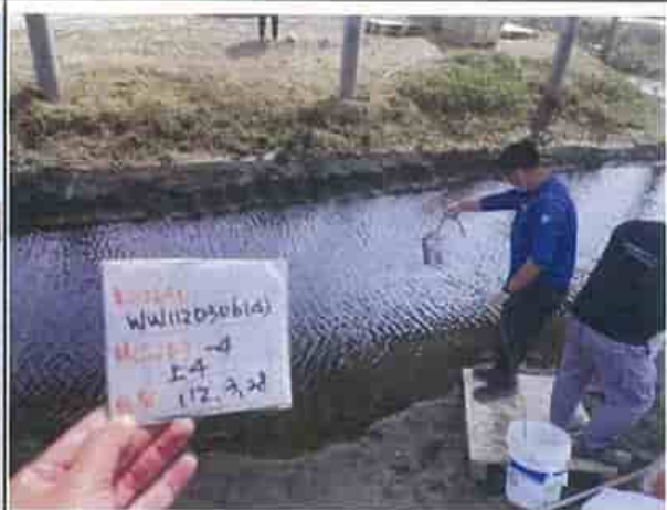
樣品名稱：下山子寮上排 4 樣品編號：WW1120306-04