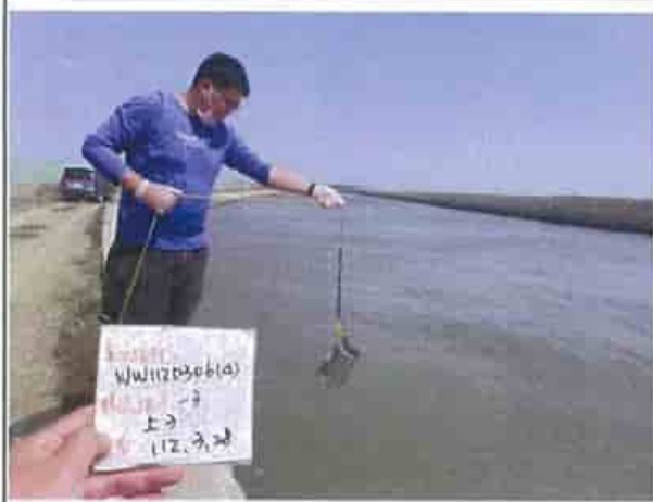
樣品名稱：下山子寮上排 3 樣品編號：WW1120306-03