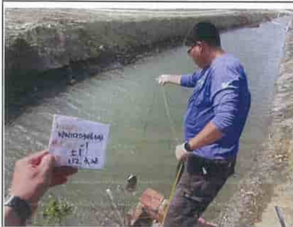
樣品名稱：下山子寮上排 1 樣品編號：WW1120306-01