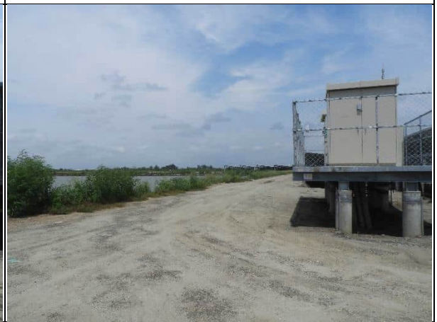
周邊環境現況-1號樣線