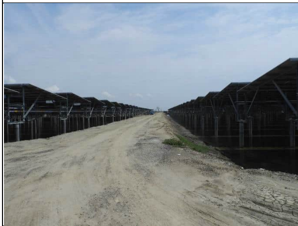
周邊環境現況-1號樣線