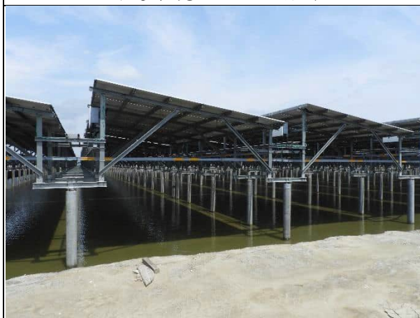
周邊環境現況-1號樣線