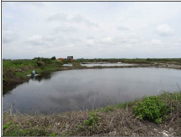
周邊環境現況-對照樣線