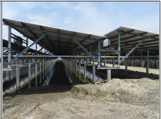
周邊環境現況-1號樣線