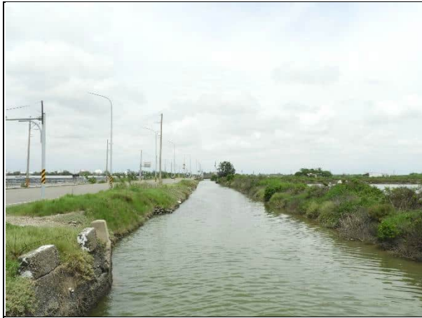
周邊環境現況-對照樣線