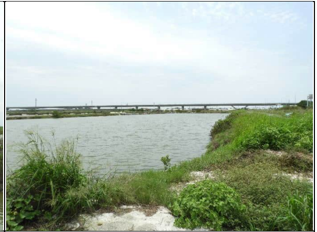
周邊環境現況-對照樣線