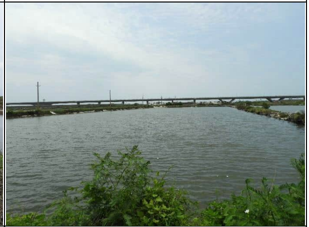
周邊環境現況-對照樣線