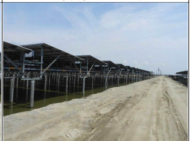
周邊環境現況-1號樣線