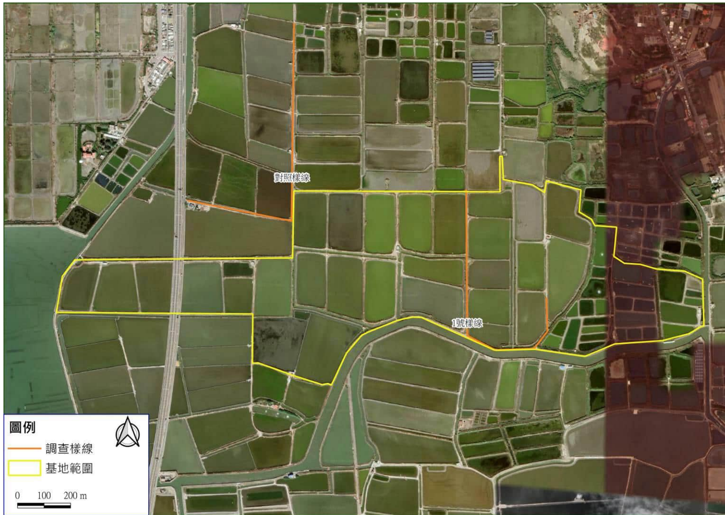
圖一、鳥類監測範圍圖