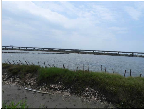
周邊環境現況-對照樣線