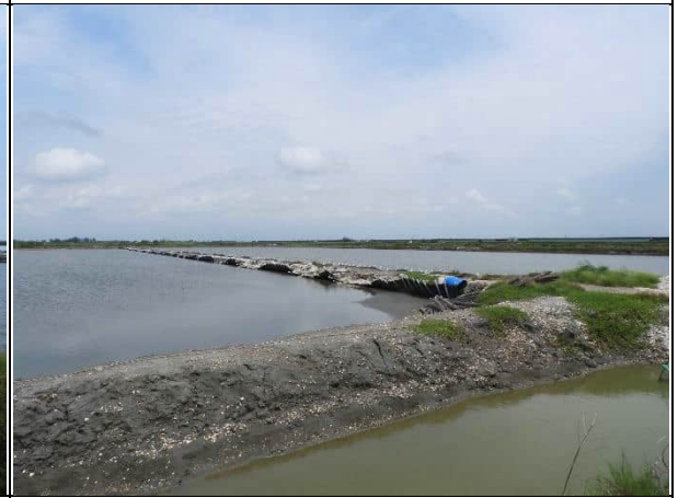
周邊環境現況-對照樣線