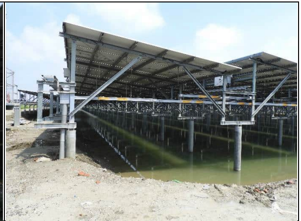
周邊環境現況-1號樣線