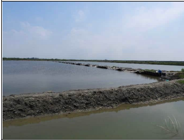
周邊環境現況-對照樣線