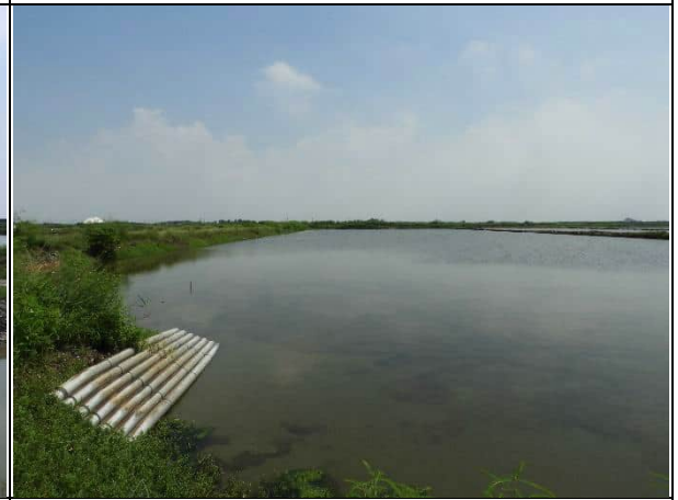
周邊環境現況-對照樣線