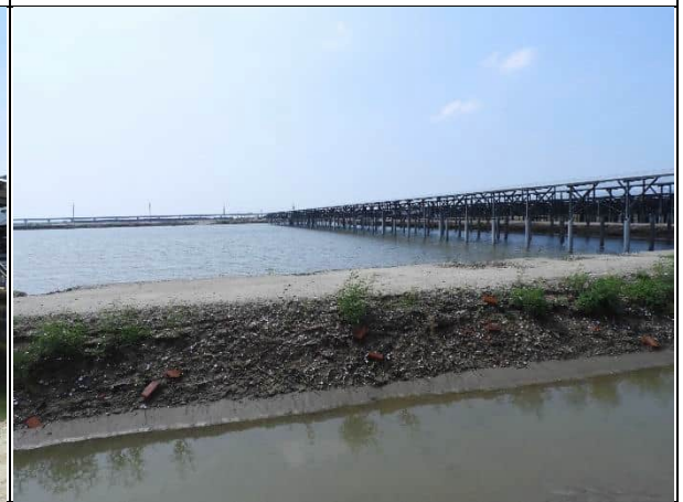
周邊環境現況-1號樣線