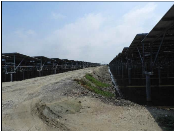
周邊環境現況-1號樣線