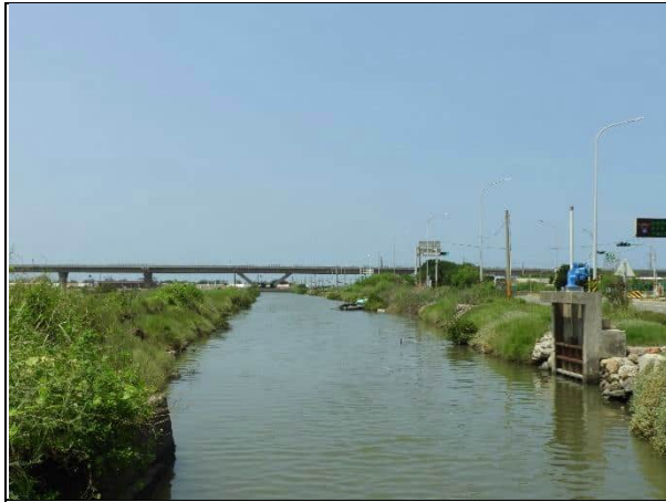
周邊環境現況-對照樣線