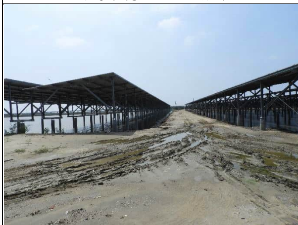
周邊環境現況-1號樣線