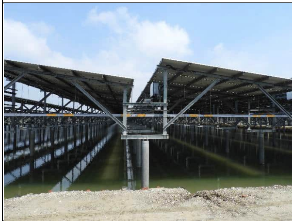
周邊環境現況-1號樣線