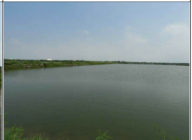
周邊環境現況-對照樣線