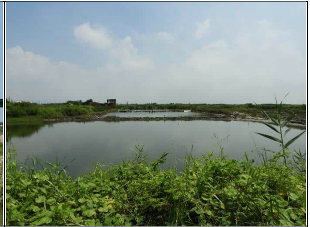
周邊環境現況-對照樣線