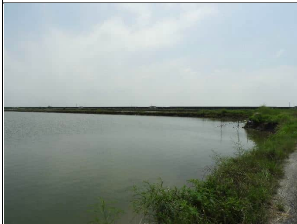
周邊環境現況-對照樣線