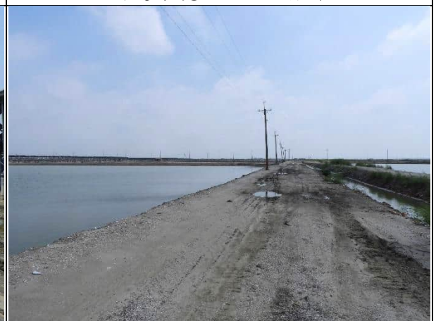
周邊環境現況-1號樣線