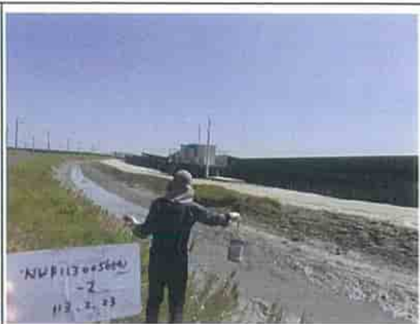
樣品名稱：下山子寮下排 2 樣品編號：NWR1130056-02