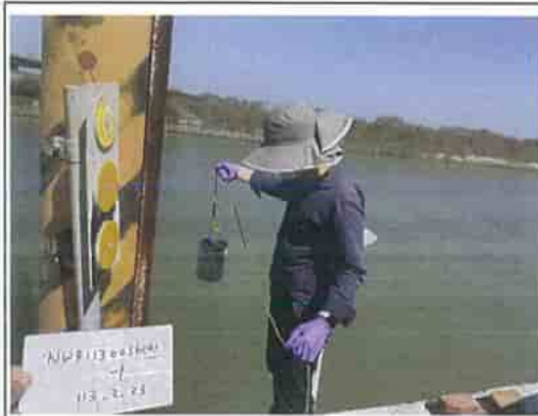
樣品名稱：下山子寮下排 1 樣品編號：NWR1130056-01