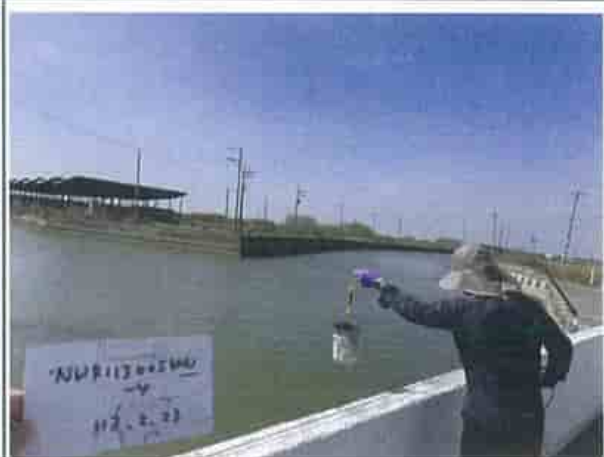
樣品名稱：下山子寮下排 4 樣品編號：NWR1130056-04