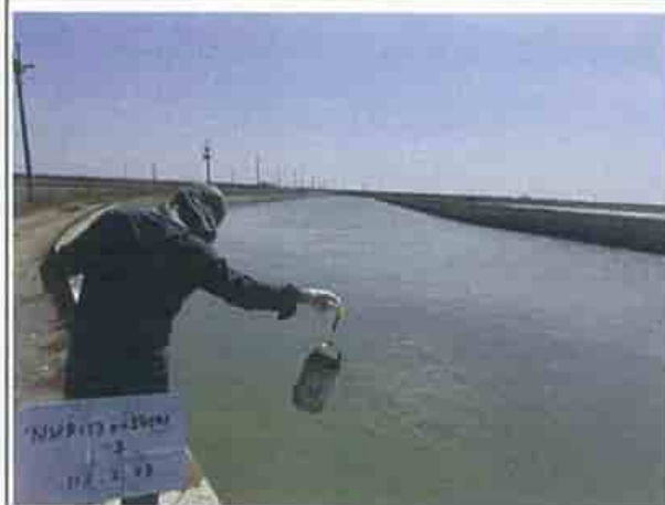
樣品名稱：下山子寮下排 3 樣品編號：NWR1130056-03