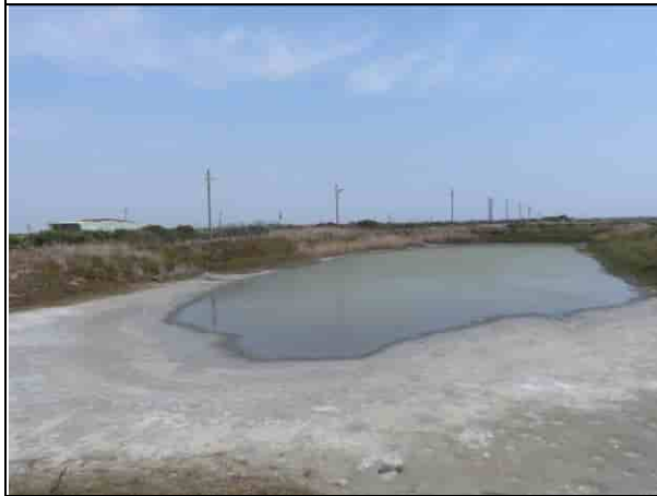
周邊環境現況-2號樣線