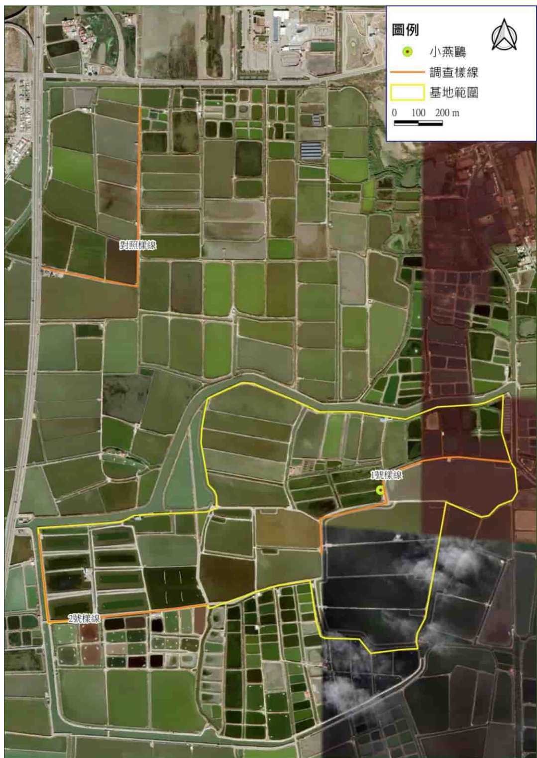
圖二、保育類動物發現位置圖-112年5月