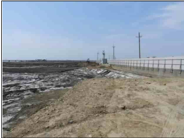
周邊環境現況-2號樣線