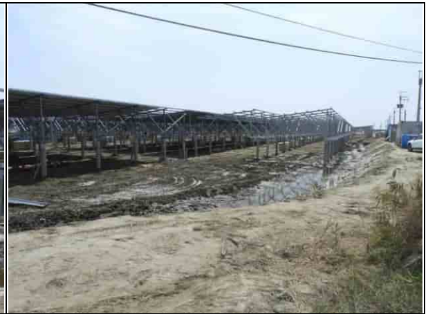
周邊環境現況-1號樣線