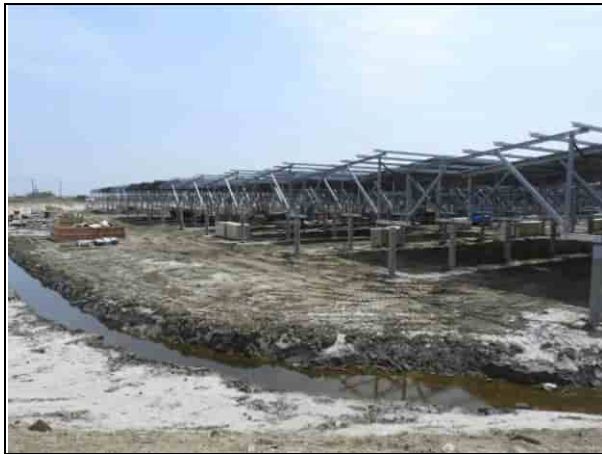
周邊環境現況-1號樣線