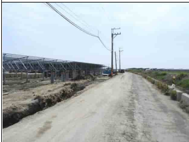
周邊環境現況-1號樣線