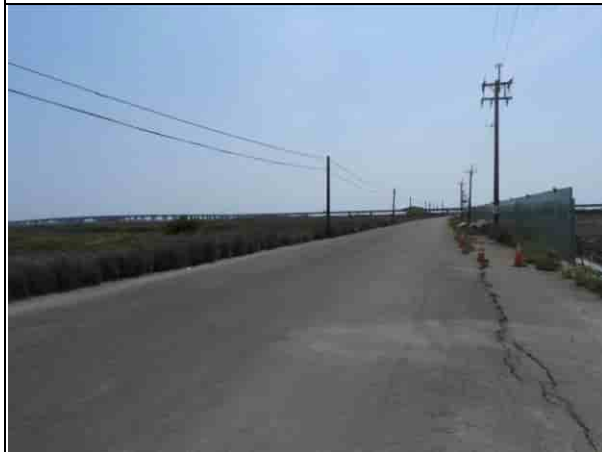
周邊環境現況-2號樣線