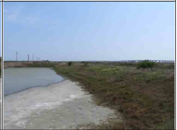
周邊環境現況-2號樣線