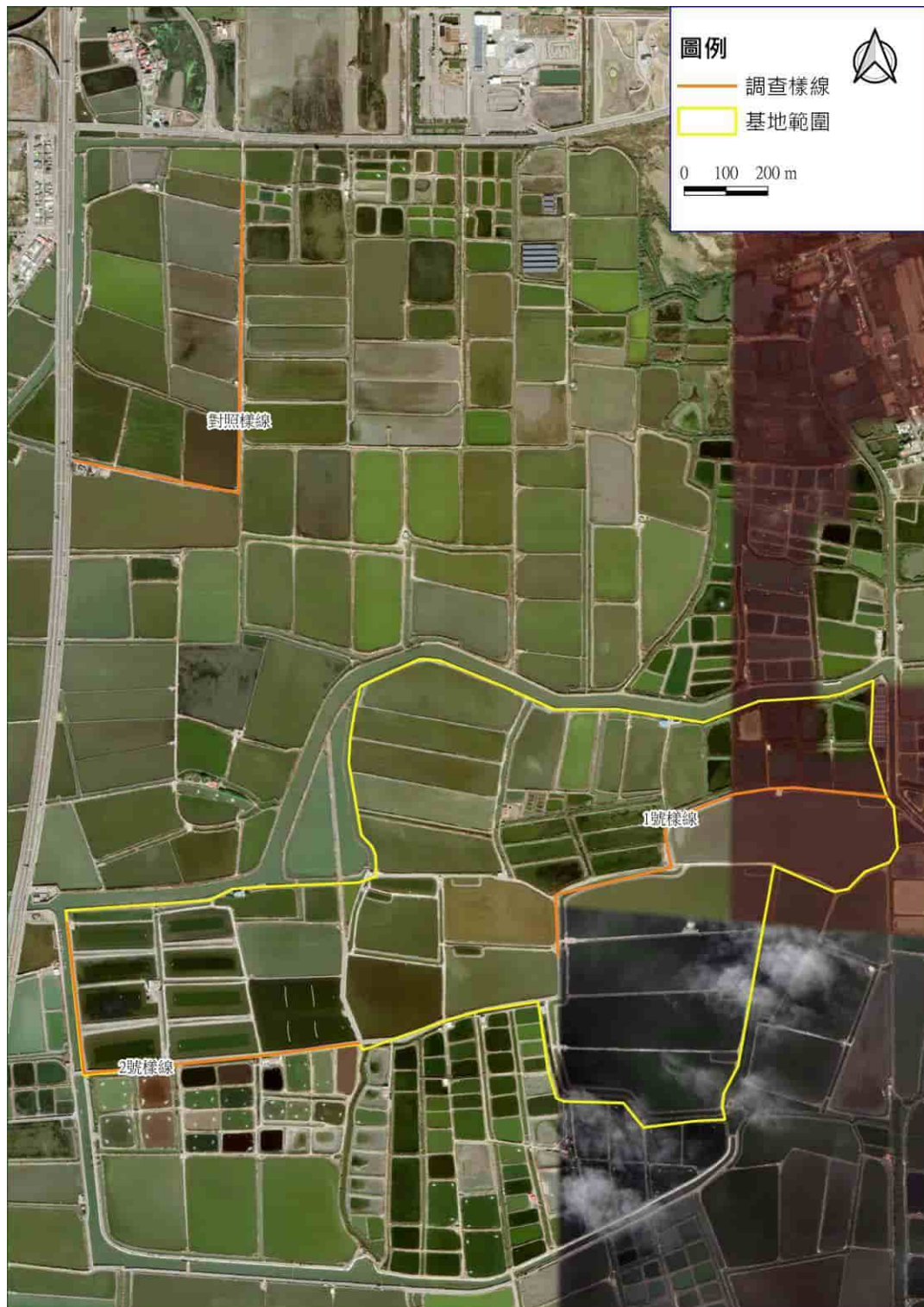
圖一、鳥類監測範圍圖