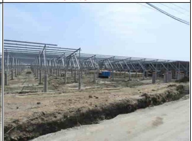
周邊環境現況-1號樣線