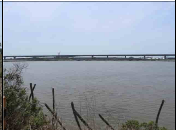
周邊環境現況-對照樣線