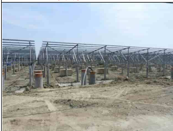
周邊環境現況-1號樣線