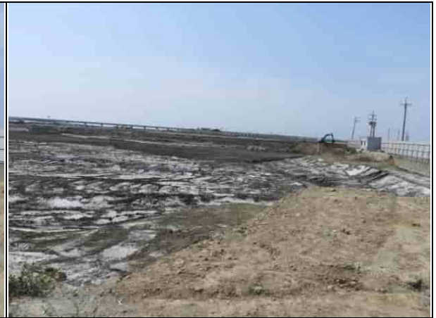
周邊環境現況-2號樣線