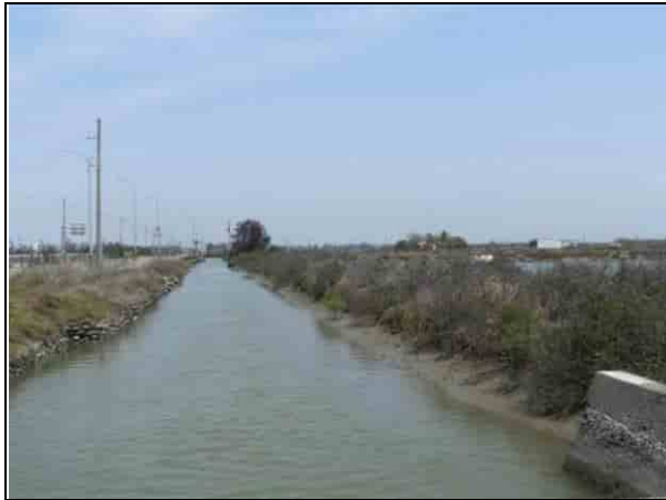
周邊環境現況-對照樣線