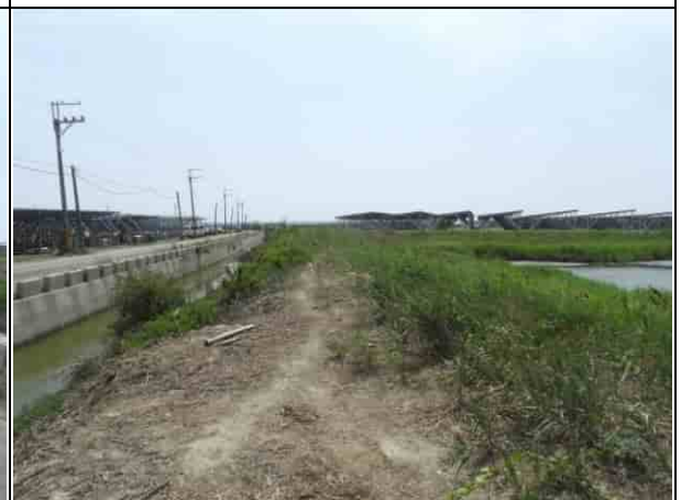
周邊環境現況-1號樣線