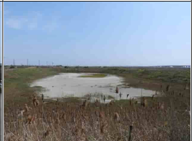
周邊環境現況-2號樣線