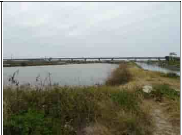
周邊環境現況-對照樣線