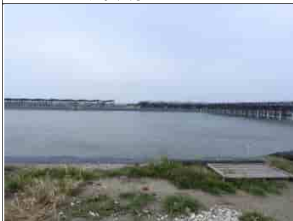
周邊環境現況-魚塭B