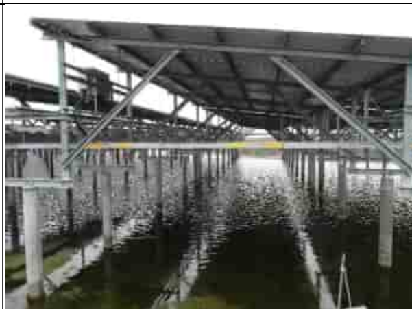
周邊環境現況-魚塭E