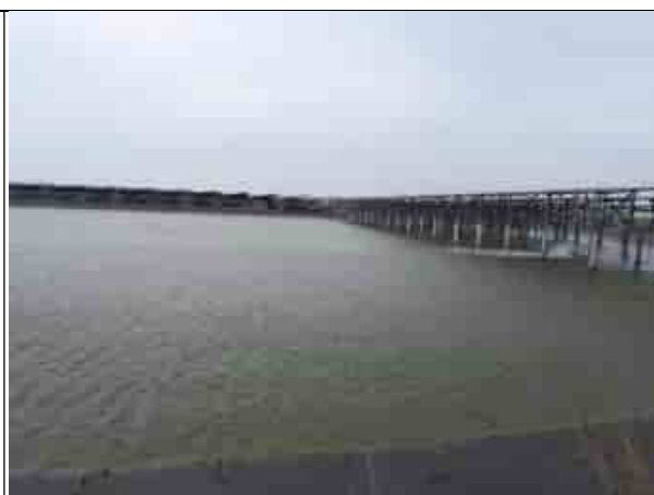
周邊環境現況-魚塭A