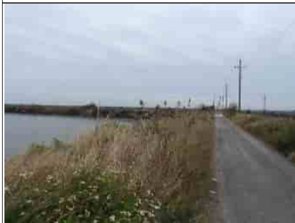
周邊環境現況-對照樣線