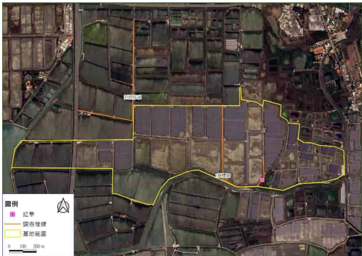
圖二、保育類動物發現位置圖-114 年 1 月