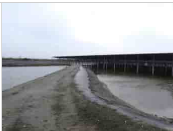
周邊環境現況-魚塭D