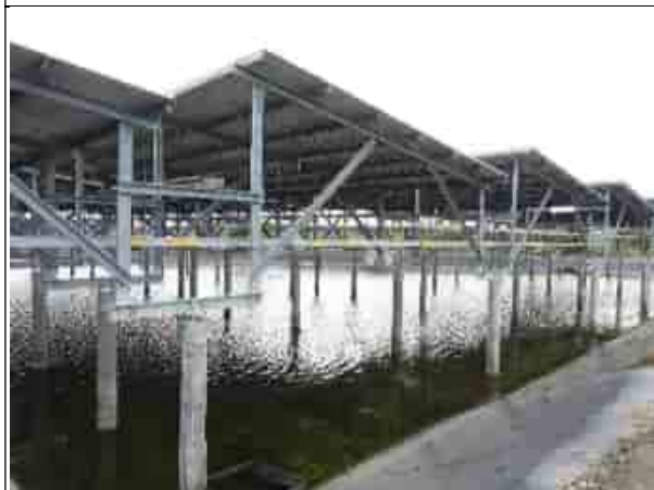
周邊環境現況-魚塭E