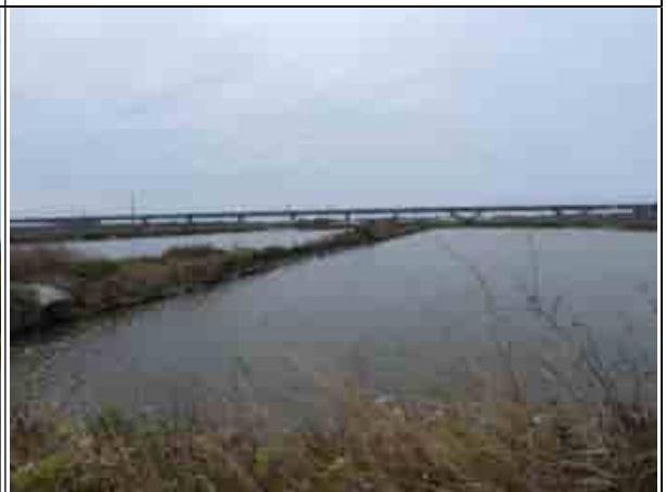
周邊環境現況-對照樣線