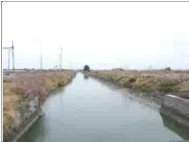
周邊環境現況-對照樣線