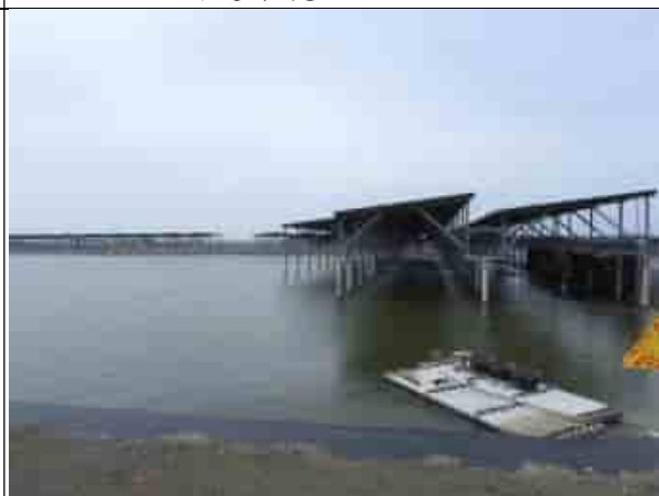
周邊環境現況-魚塭B