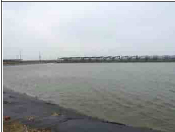
周邊環境現況-魚塭C