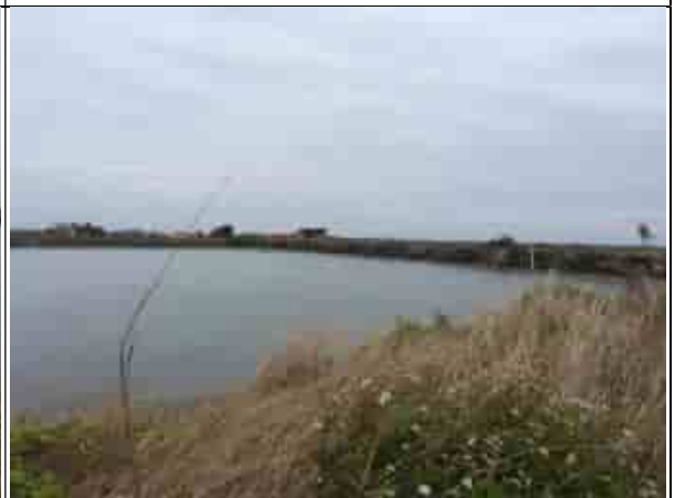
周邊環境現況-對照樣線