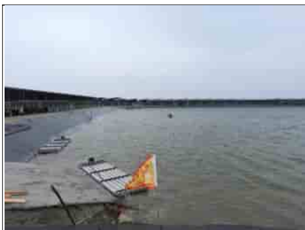
周邊環境現況-魚塭A