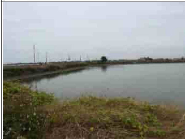
周邊環境現況-對照樣線