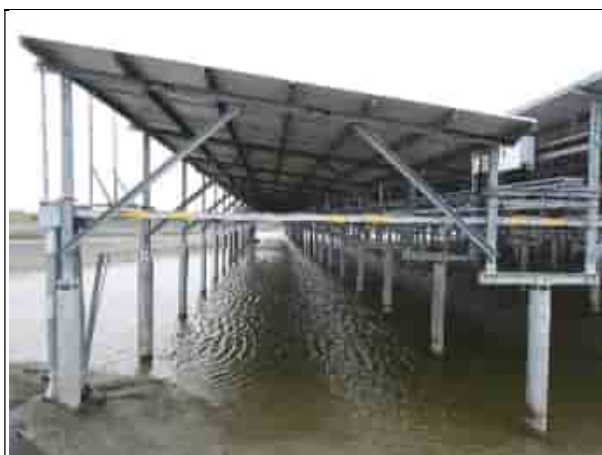
周邊環境現況-魚塭D