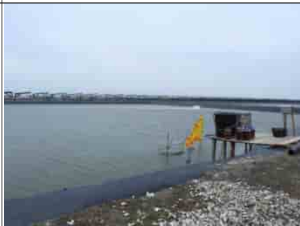
周邊環境現況-魚塭C