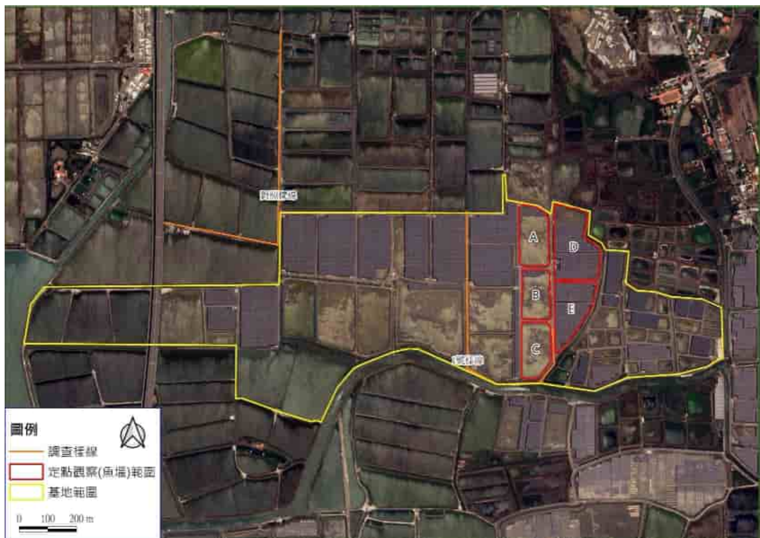
圖一、鳥類監測範圍圖