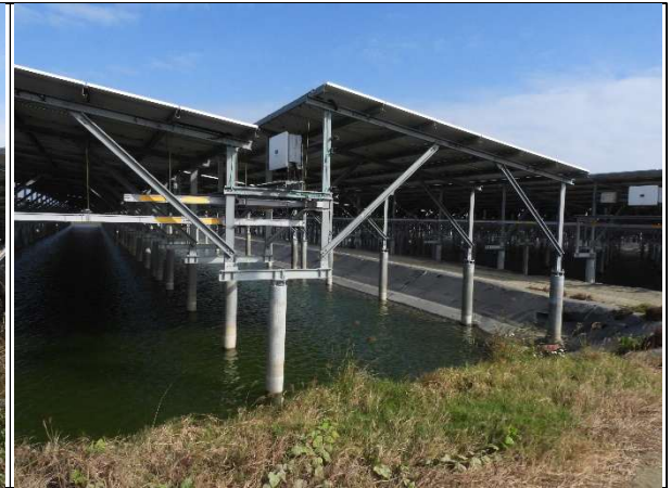
周邊環境現況-魚塢D