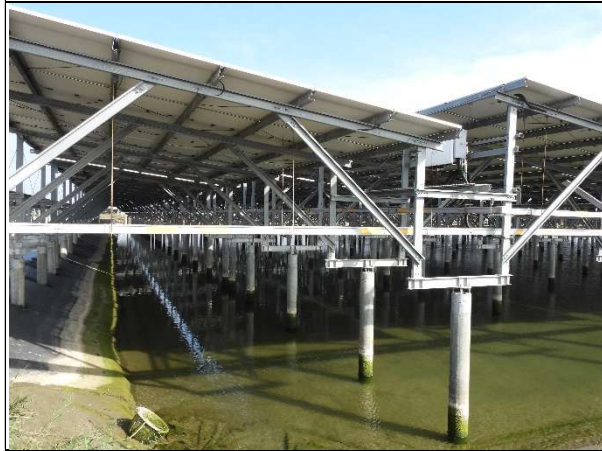
周邊環境現況-魚塢E