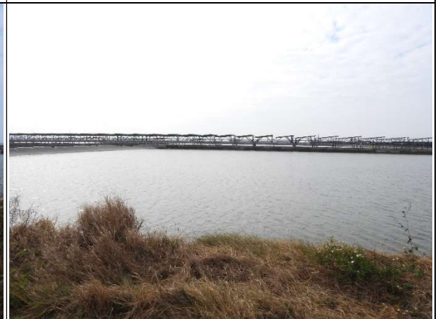
周邊環境現況-魚塭B