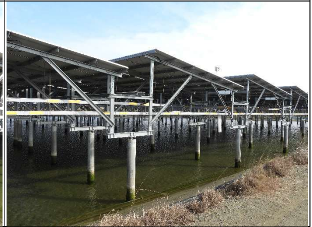
周邊環境現況-魚塢E