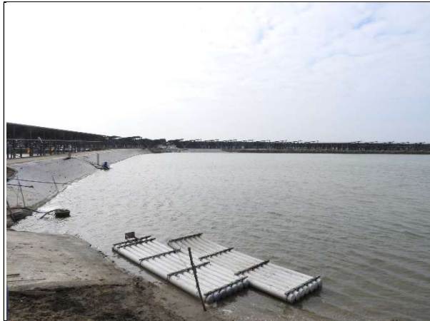
周邊環境現況-魚塭A