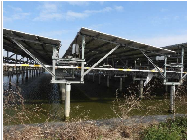
周邊環境現況-魚塢D