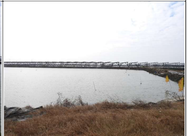
周邊環境現況-魚塭C