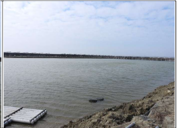
周邊環境現況-魚塭A