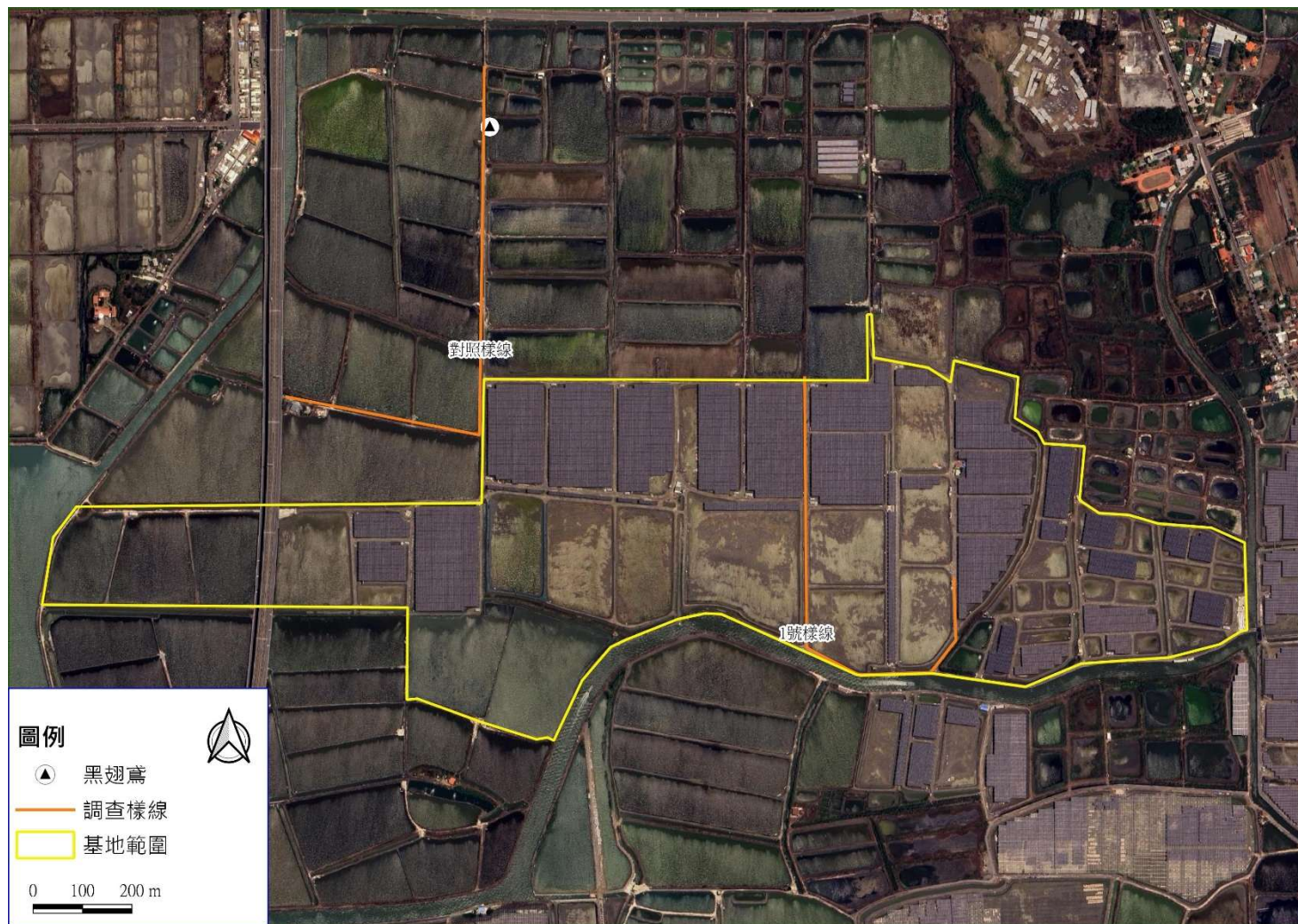
圖二、保育類動物發現位置圖-115年2月