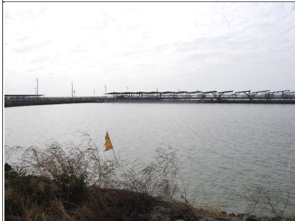
周邊環境現況-魚塭C