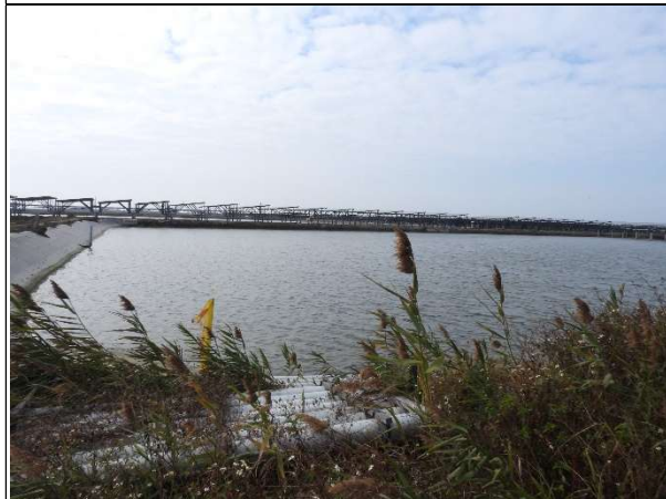
周邊環境現況-魚塭B