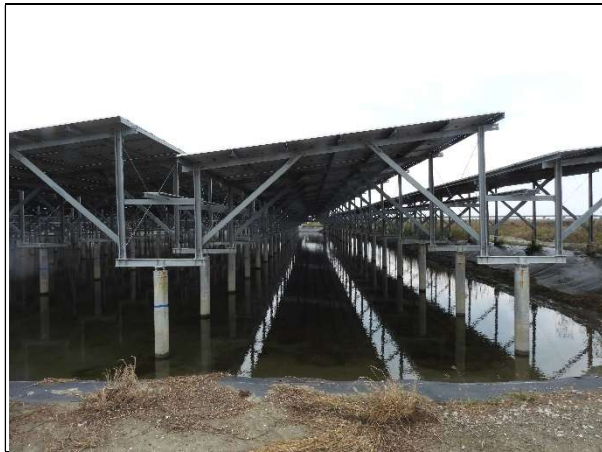
周邊環境現況-1號樣線