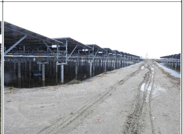
周邊環境現況-1號樣線