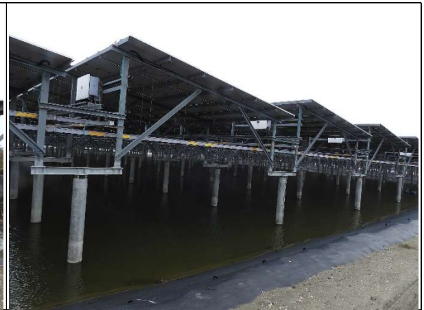
周邊環境現況-1號樣線