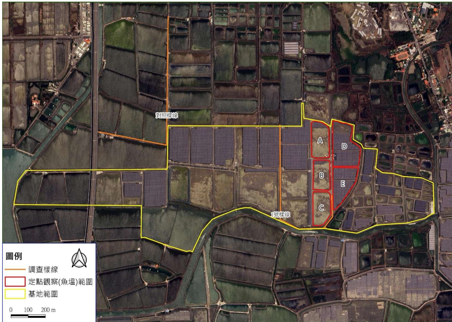
圖一、鳥類監測範圍圖